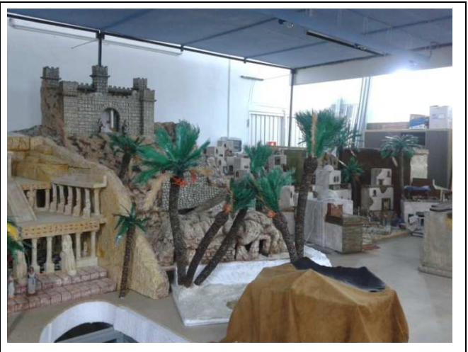
Belén en año 2011 en construcción