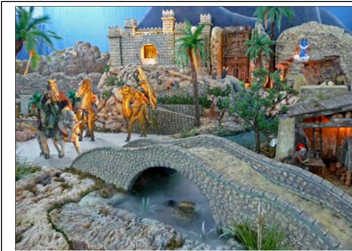
Belén en año 2010

Pedimos vuestra colaboración con la búsqueda de encontrar las figuras y mecanismos del Belén Histórico, que recordamos (si alguien las tiene) que nos las presten para devolverlas una vez terminada la exposición del Belén.